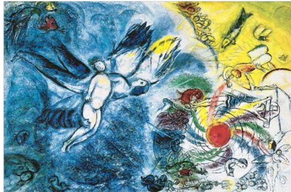
Marc Chagall, La Création de l'homme (1956-58)