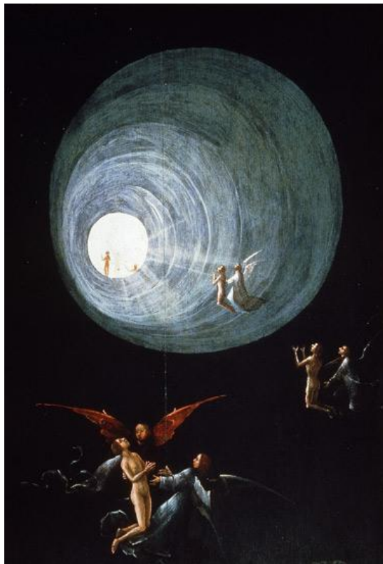
Jérôme Bosch, L'Ascension vers l'Empyrée (vers 1500)

Un nouveau plan de conscience peut alors se révéler : le surconscient, lié au sens des Valeurs et de la Transcendance. Il ressemble étrangement à la Conscience transpersonnelle que les mystiques disent avoir expérimentée, quelle que soit leur religion d'origine : un plan de conscience universel et immuable, au-delà de l'ego limité où chacun de nous croit être enfermé. L'image du patient devient un Symbole, c'est-à-dire un lien qui le réconcilie avec le meilleur de lui-même, l'espace de paix et de lumière qui repose au plus profond de lui. Dès lors, toutes les névroses apparaissent pour ce qu'elles sont en réalité : une agitation de surface qui jamais n'entame la sérénité de la conscience profonde.