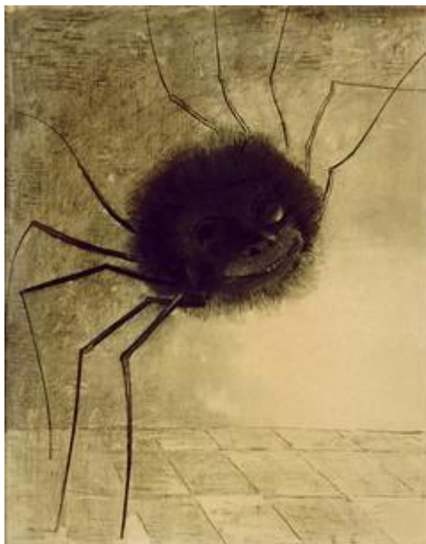
Odilon Redon, L'Araignée souriante (1881)

Le rêve-éveillé correctement conduit (le praticien intervient lorsque le commentaire ou le souvenir font intrusion dans le film des images) peut donc être considéré comme un nettoyage ou une purification de nos perceptions. L'inconscient produit des images qui ont un rapport direct avec notre histoire ; et le patient contribue, par sa qualité de conscience et de vigilance, à rendre à ces images leur pureté perdue. Si par exemple l'image d'une araignée terrifiante jaillit dans l'esprit du patient, celle-ci sera vue comme pure représentation accompagnée d'une forte émotion, sans que pour autant le commentaire vienne alourdir cette émotion d'un poids artificiel. De même, le fait que les souvenirs liés au thème de l'araignée soient tenus à distance permet à cette image d'être accueillie comme telle, dans son jaillissement spontané, presque... souriant.